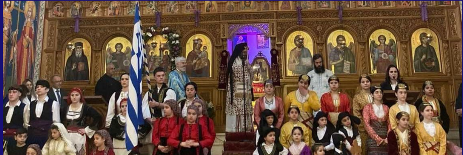
Gottesdienst für den 25. März 1821 an der Kirchengemeinde „Mariä Verkündigung“ (Ludwigshafen) und an der Kirchengemeinde Prophet Elias Frankfurt

Griechisches Generalkonsulat in Frankfurt am Main Zepelinallee 43 60325 Frankfurt am Main Telefon: (0)69 97 991211 E-Mail: grgencon.fra@mfa.gr https://www.mfa.gr/germany/geniko-proxeneio-fragfourtis/